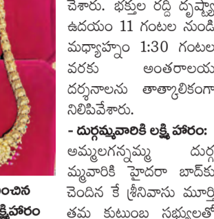
భక్తులందరినీ బంగారు లక్ష్మీపఠం