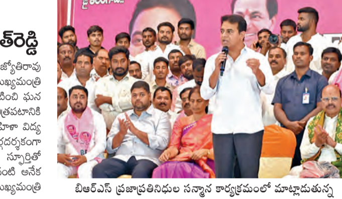
బిఆర్ఎస్ ప్రజాప్రతినిధుల సన్మాన కార్యక్రమంలో మాట్లాడుతున్న బిఆర్ఎస్ చర్కింగ్ ప్రెసిడెంట్ కేటీఆర్

ప్రభాతవార్త ప్రధాన ప్రతినిధి, హైదరాబాద్, ఏప్రిల్ 11: మహాత్మా జ్యోతిరావు పూలే జయంతిని పురస్కరించుకుని ఢిల్లీలోని తన నివాసంలో ముఖ్యమంత్రి ఎ. రేవంత్ రెడ్డి ఆ మహాత్ముడి చిత్రపటానికి పుష్పాంజలి ఘటించి ఘన నివాళి అర్పించారు. అలాగే శ్రీ మల్లు రవి కూడా పాల్గొని పూలే చిత్రపటానికి అంజలి ఘటించారు. సింఠం వర్గాల సామాజిక న్యాయం, మహిళా విద్య కోసం జ్యోతిరావు పూలే చేసిన విశేష కృషి అందరికీ మార్గదర్శకంగా నిలుస్తుందని పేర్కొన్నారు. సామాజిక సాధికారత కోసం పూలే స్ఫూర్తితో తెలంగాణలో సమగ్ర కుల గణన, ఎన్నో ఉపకలాల పర్యవేక్షణ వంటి అనేక నిర్ణయాలు తీసుకుని ప్రభుత్వం ముందుకు సాగారోందని ముఖ్యమంత్రి రేవంత్ రెడ్డి గుర్తించారు.