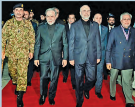
చర్యలకోసం పాక్ వచ్చిన ఇరాన్ ప్రతినిధుల బృందం

ఇస్లామాబాద్లో 'అమెరికా, ఇరాన్ మధ్య తొలిరోజు నాలుగు గంటలు చర్చలు పాక్ ప్రధాని షేహబాజ్ షరీఫ్ మధ్యవర్తిత్వం స్తంభించిన ఆస్తులు, నిధులు విడుదల చేయాలని ఇరాన్ డిమాండ్ కొత్త షరతులతో ముందుకు సాగని చర్చలు హార్డుకోపై కొనసాగుతున్న ప్రతిష్టంభన