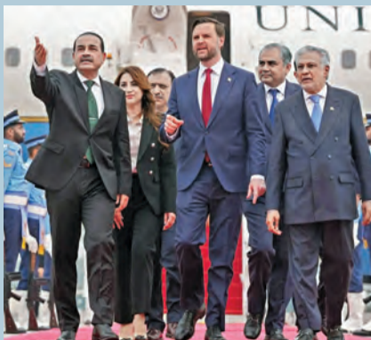
శనివారం ఇస్లామాబాద్ చేరుకున్న జెడిఎస్ బృందం ఇస్లామాబాద్, ఏప్రిల్ 11: ఇరాన్ సై యుద్ధం ముగింపు కోసం అమెరికా, ఇరాన్ దేశాలమధ్య జరుగుతున్న శాంతి చర్చల్లో పురోగతి కనిపించకపోయినా ఒకరి డిమాండ్ చార్జర్ మరోకరు పంచుకున్నారు. >>2

ఇస్లామాబాద్లో 'అమెరికా, ఇరాన్ మధ్య తొలిరోజు నాలుగు గంటలు చర్చలు పాక్ ప్రధాని షేహబాజ్ షరీఫ్ మధ్యవర్తిత్వం స్తంభించిన ఆస్తులు, నిధులు విడుదల చేయాలని ఇరాన్ డిమాండ్ కొత్త షరతులతో ముందుకు సాగని చర్చలు హార్డుకోపై కొనసాగుతున్న ప్రతిష్టంభన