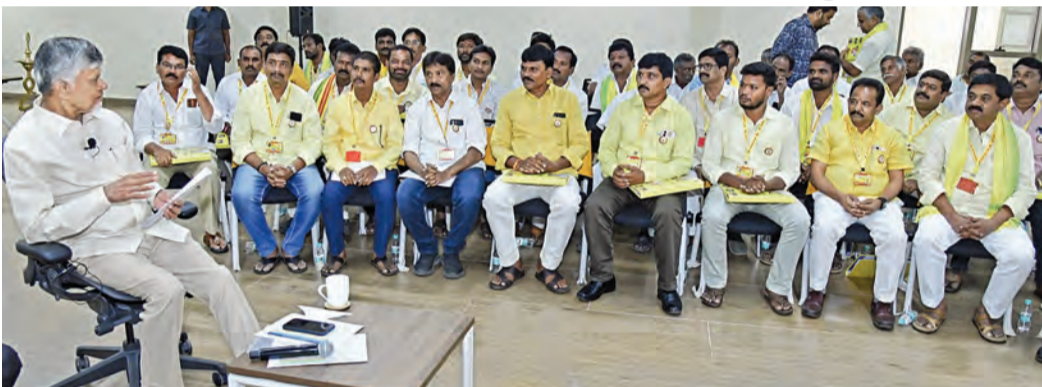
శనివారం డిడిపి కార్యకర్ల శిక్షణ కార్యక్రమంలో పాల్గొన్న సీఎం చంద్రబాబు నాయుడు

పాల్గొనేతలు, కార్యకర్తలకు సీఎం చంద్రబాబు సలహా పాల్గొ బలోపేతానికి 'ఇ-3' కార్యక్రమం ప్రభుత్వం కష్టాలు ప్రజలకు వివరించాలి శిక్షణ కార్యక్రమంలో పాల్గొన్న ముఖ్యమంత్రి