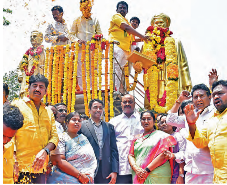
శనివారం మహాత్మా జ్యోతిబా పూలే జయంతినందంగా ఆయన విగ్రహానికి నివాళి అర్పిస్తున్న మంత్రులు