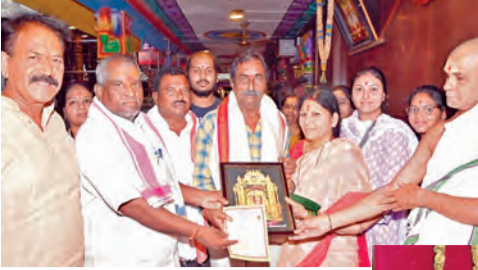
దాతలకు దుర్ఘటనల అందజేస్తూ దుశ్శం

చేసుకున్నారు. ఇది ప్రభుత్వ ధనాన్ని పక్కాపట్టిన పట్టింపడమే కాకుండా, గ్రామ అభివృద్ధిని కుంటుపరిచే చర్య. గ్రామంలో మౌలిక సదుపాయాల కల్పనను గాలికి వదిలేసి, కేవలం స్వలాభం కోసమే అధికారులు, ప్రజా ప్రతినిధులు పని చేస్తున్నారు. కావున వారిపై చర్యలు తీసుకోని ఆ నిధులను రికవరీ చేయాలని కోరాం. మార్కెట్ కమిటీని ఏర్పాటు చేసి, దీనిపై రెవెన్యూ అధికారులకు ఫిర్యాదు చేసినా, స్థానిక విలేజ్ రెవెన్యూ ఆఫీసర్, సర్పంచ్ ఆక్రమణదారులకే సహకరిస్తూ తనకు అన్యాయం చేస్తున్నారు. గొడ్డళ్ళ, కొడవళ్లతో తనపై దాడికి దిగి, వంపిస్తూమని చెబుతున్నారు. వారి నుండి ప్రాణాలు కాపాడుకోవడానికి పోలీసులను ఆశ్రయించినా అక్కడ కూడా నాకు సరైన సహకారం అందలేదు.